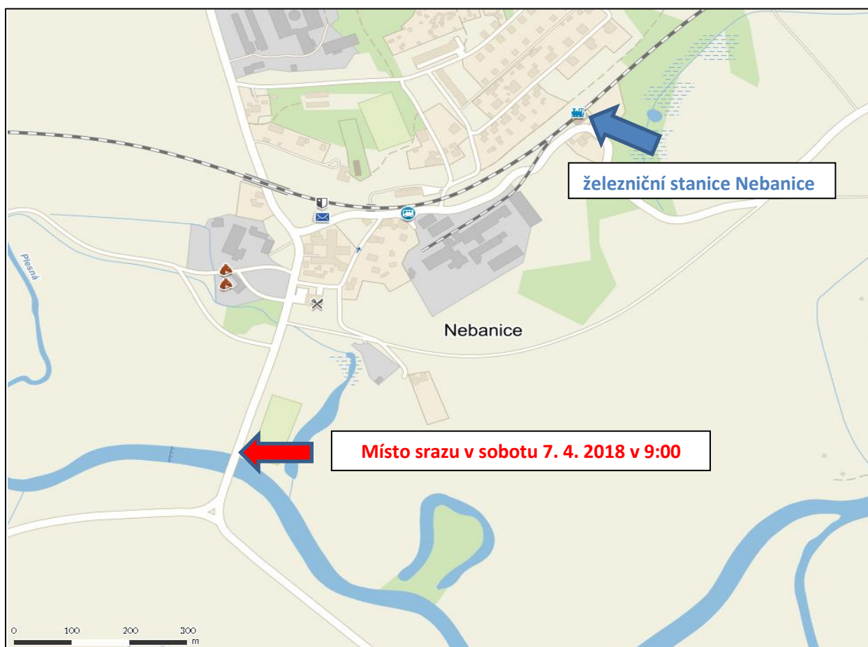
Obrázek 1: Místo srazu v Nebanicích