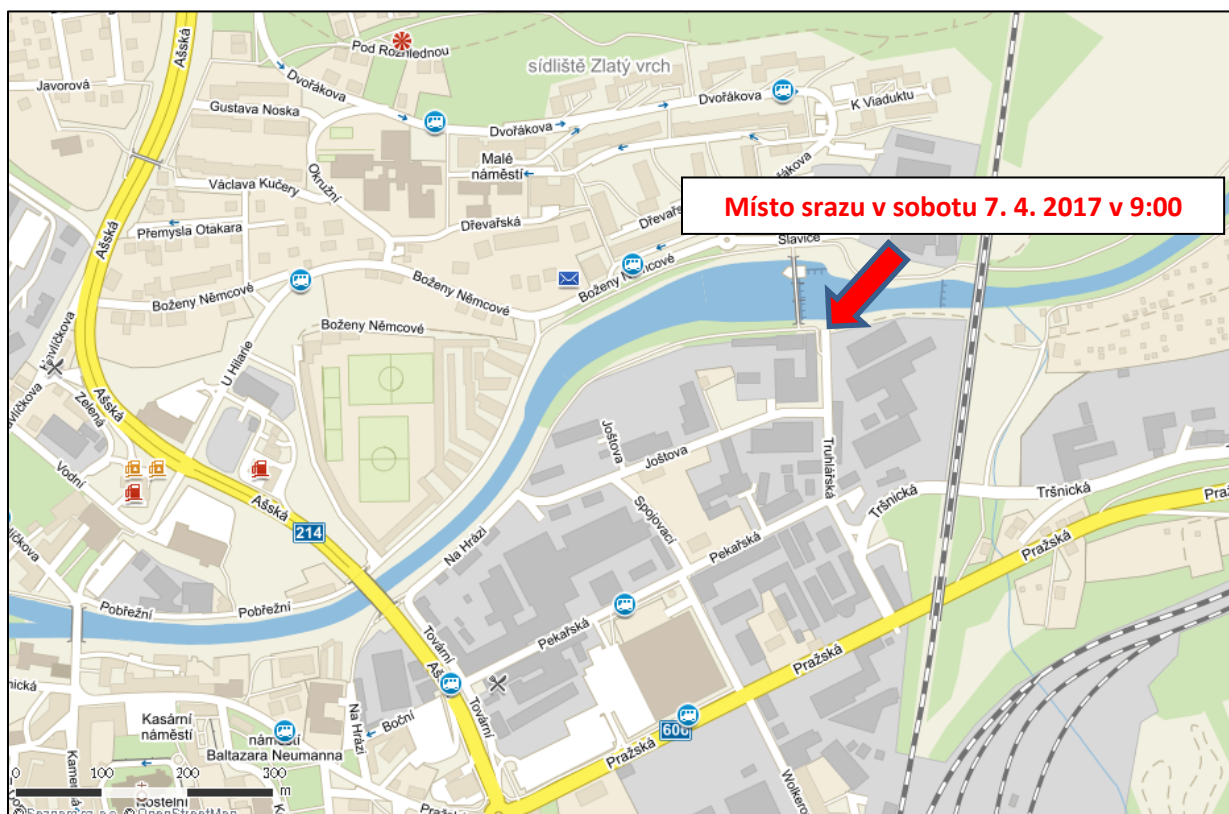
Obrázek 1: Místo srazu v Chebu u Ottova mostu