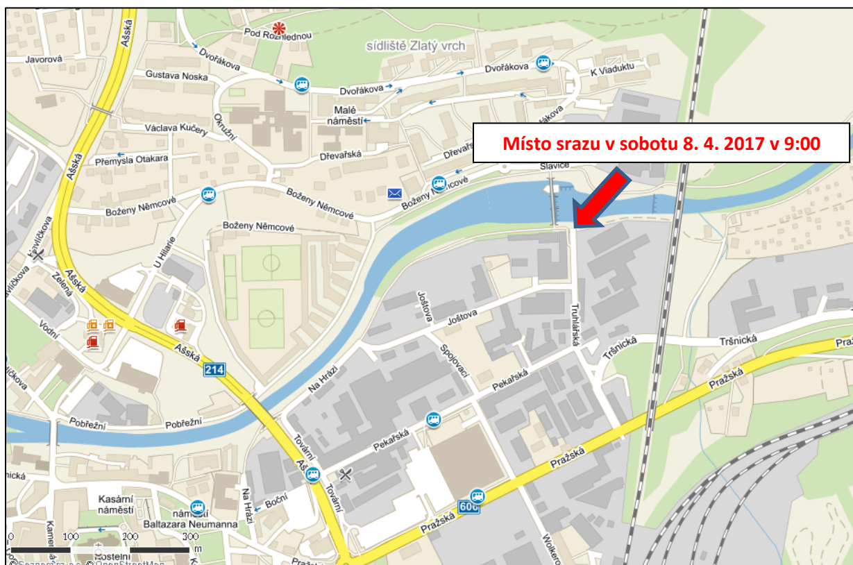
Obrázek 1: Místo srazu v Chebu u Ottova mostu