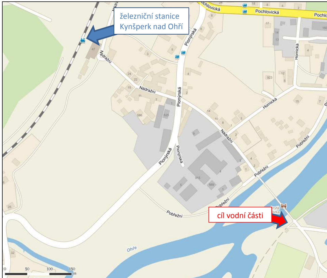
Obrázek 2: Kudy od řeky na nádraží