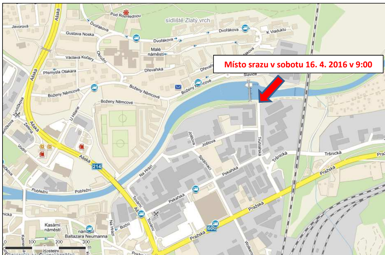
Obrázek 1: Místo srazu v Chebu u Ottova mostu